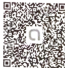
QR code กลุ่ม Openchat Line