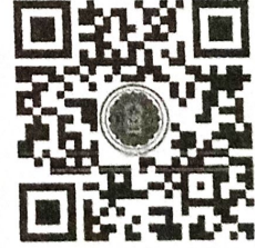
QR code ห้อง Zoom Meeting วันจันทร์ที่ ๒๓ ธันวาคม ๒๕๖๗