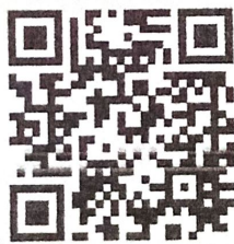
QR code เอกสารการอบรม