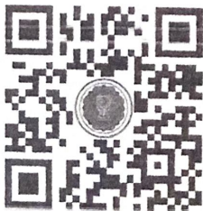
QR code ห้อง Zoom Meeting วันพฤหัสบดีที่ ๑๙ ธันวาคม ๒๕๖๗