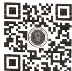
QR code ห้อง Zoom Meeting วันจันทร์ที่ ๒๓ ธันวาคม ๒๕๖๗