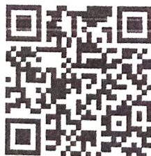
QR code เอกสารการอบรม