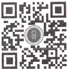
QR code ห้อง Zoom Meeting วันพฤหัสบดีที่ ๑๙ ธันวาคม ๒๕๖๗