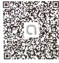
QR code กลุ่ม Openchat Line